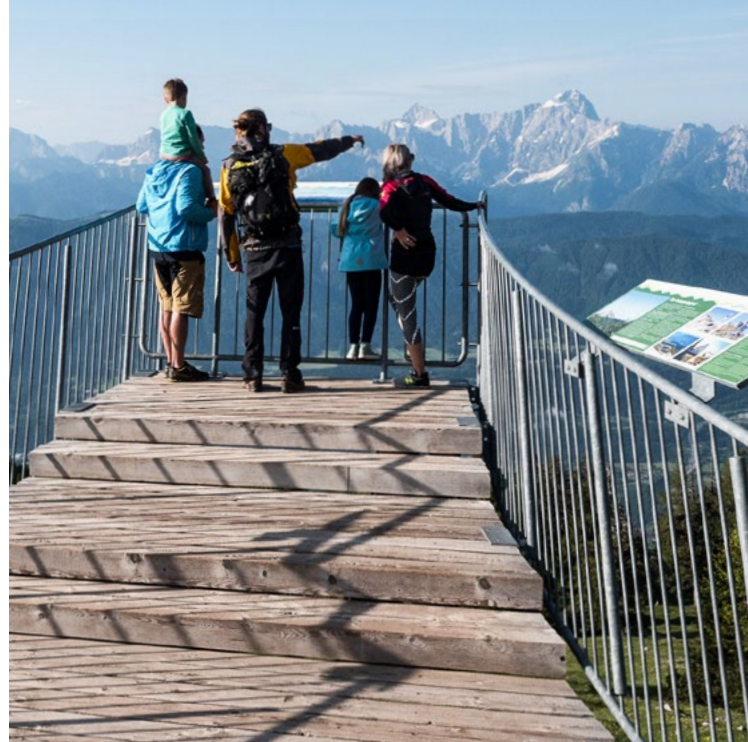
Barrierefreier Skywalk „Rote Wand“, Parkplatz P6